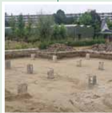
Plaatsen begane grond