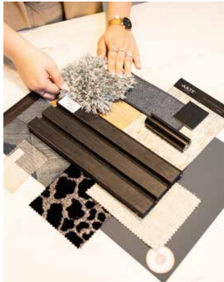
Het juiste interieurontwerp