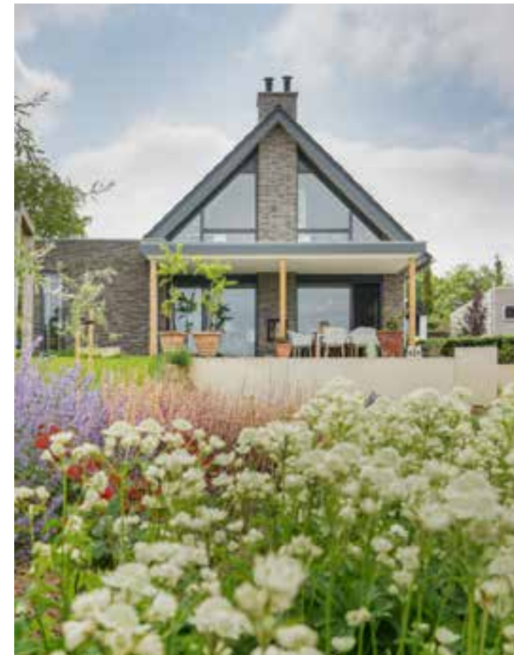
Het juiste tuinontwerp