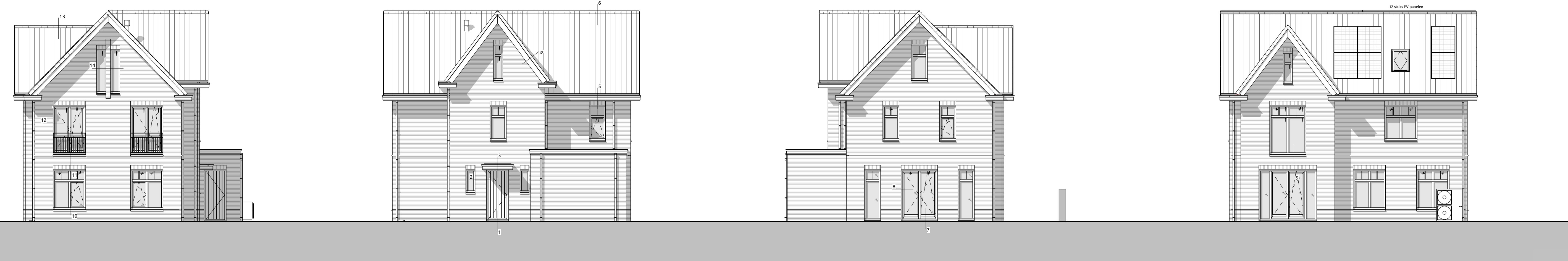
Voorgevel 1:100 Rechtergevel 1:100 Achtergevel 1:100 Linkergevel 1:100

Project: Park Breloft Bouwlocatie: Oude Zeeweg 10 kavel 3, te Noordwijk Datum getekend: 10-06-2024 Tekeningnummer: VB-01 Projectnummer: 23-0132-3