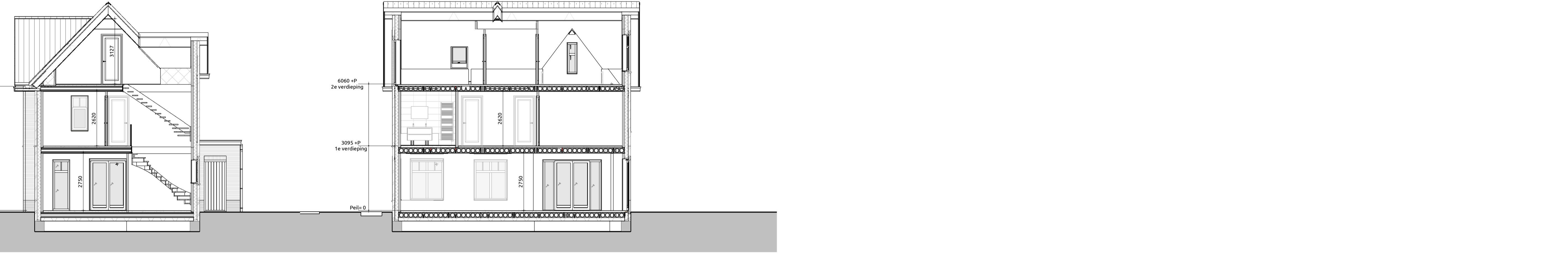
Doorsnede A-A 1:100 Doorsnede B-B 1:100